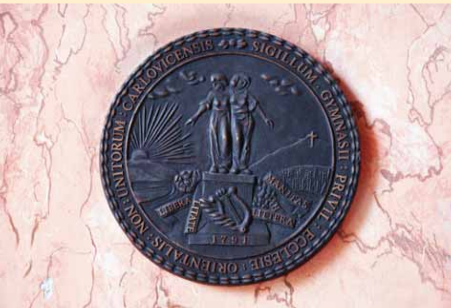
Грб Карловачке гимназије (барелеф)