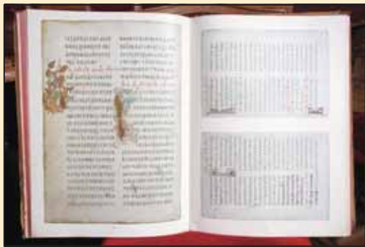
Фототипско издање Мирославјевог јеванђеља