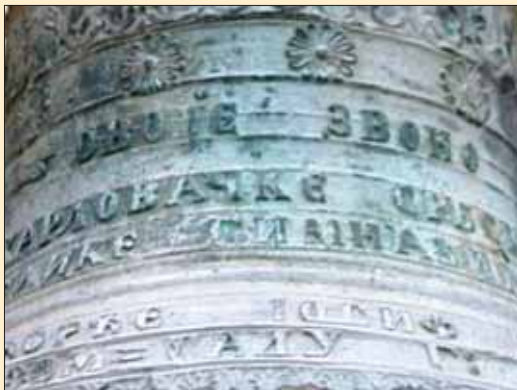
Звоно Карловачке гимназије, детаљ

та реченица: „ Ово је звоно Карловачке српске Велике Гимназије ”, док се на другој страни налази рељеф патрона школе и њеног заштитника, светог Саве.