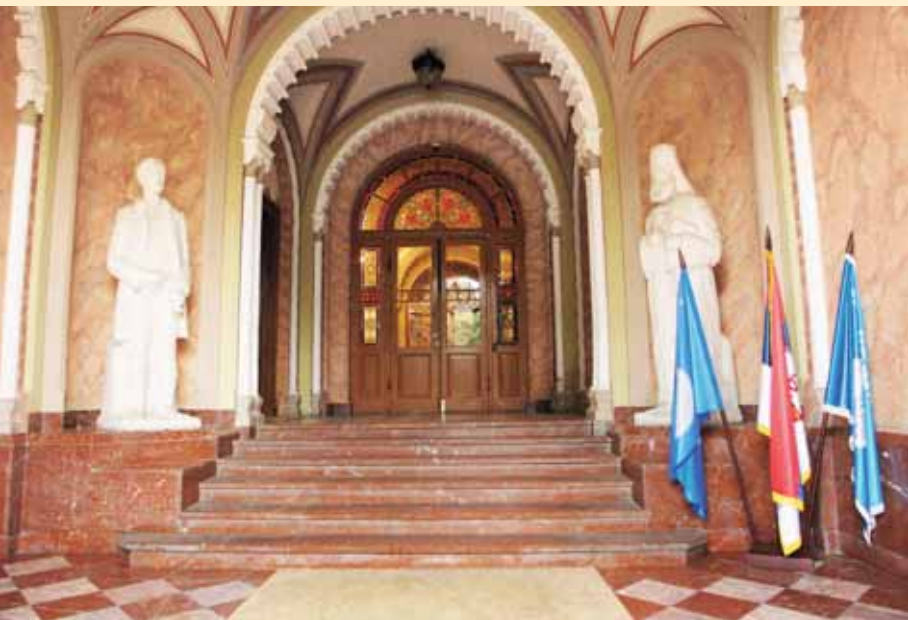
Улаз у Гимназију и скулптуре оснивача