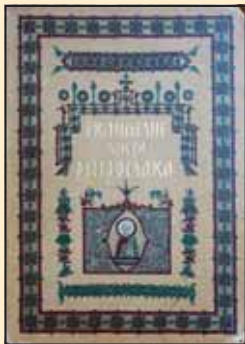
Фототипско издање Мирослављевог јеванђеља

године, Вечни календар Захарија Орфелина из 1783, Граматика Малетија Смотричког из 1721. и 1755. године, Историја Јована Ра-