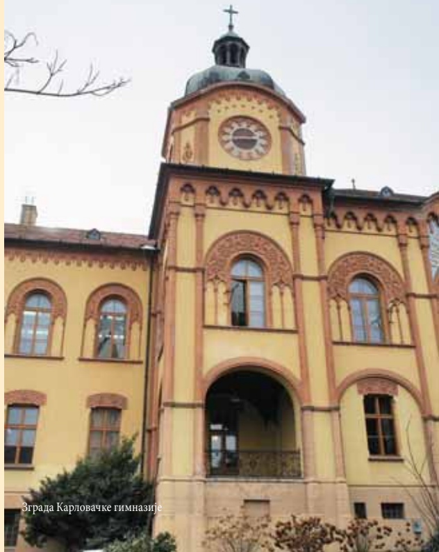
Зграда Карловачке гимназије