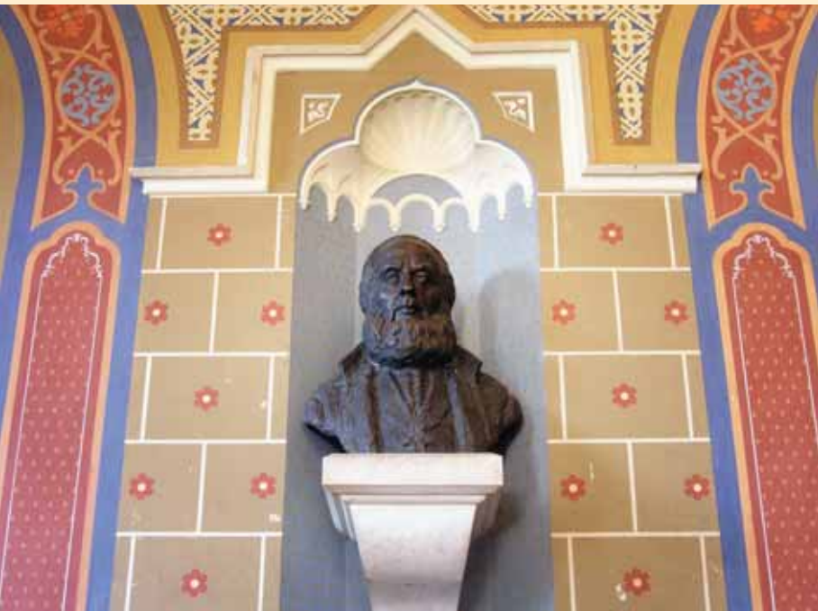
Биста митрополита Стефана Стратимировића у Свечаној сали