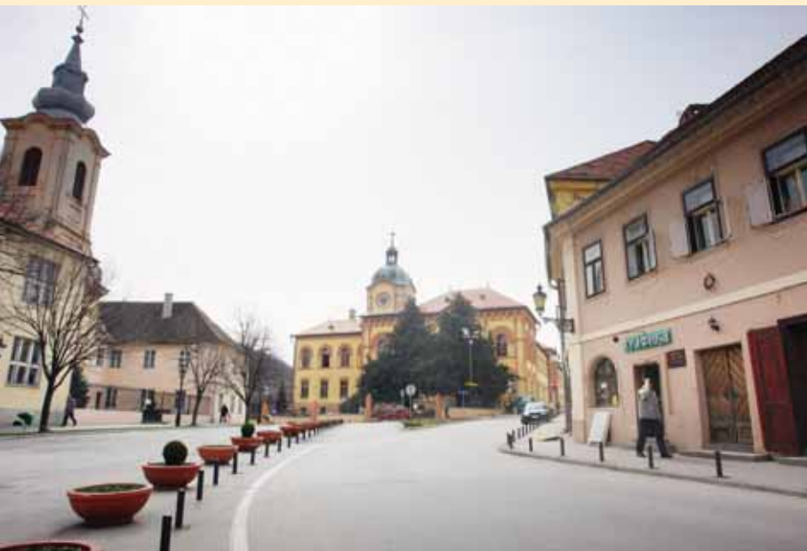
Трг испред Гимназије