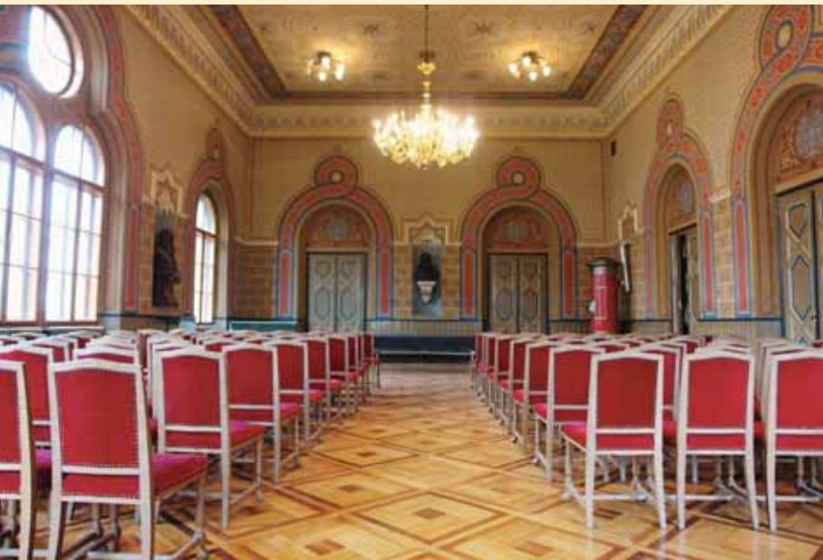
Свечана сала Гимназије