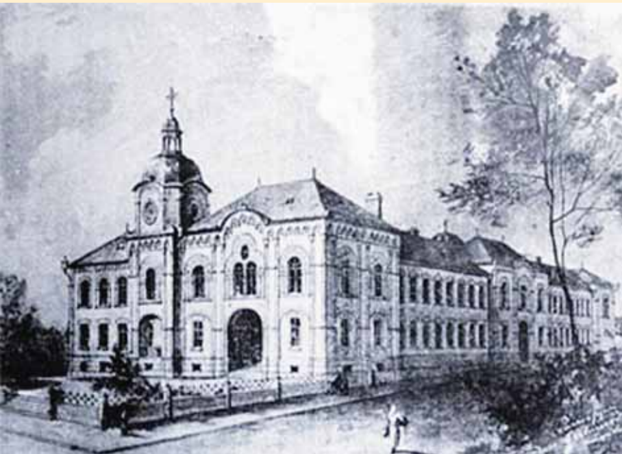
Нови изглед Гимназије