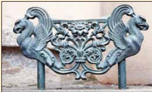
Отирач за ноге на улазу

те да се при том оснивају још и Патронат и Старатељство гимназијских фондова. Прве школске 1791/92. године гимназијски Патронат отворио је припремни разред, из којег су ученици после положеног испита били уписани у први разред.