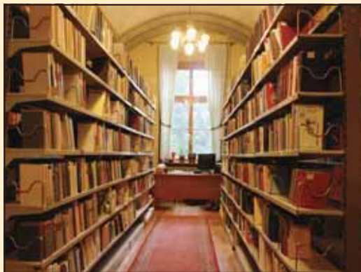
Школска библиотека Карловачке гимназије