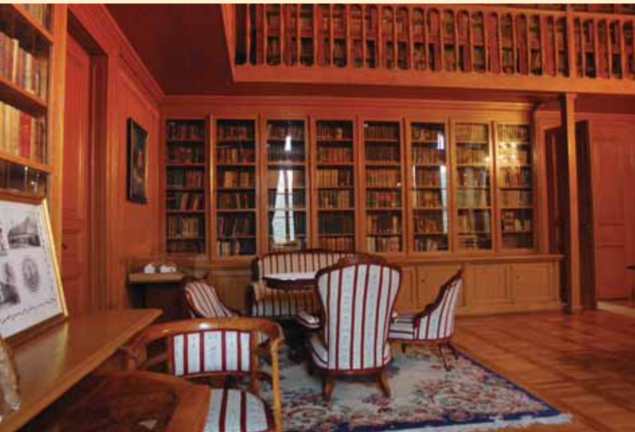
Спомен-библиотека Карловачке гимназије