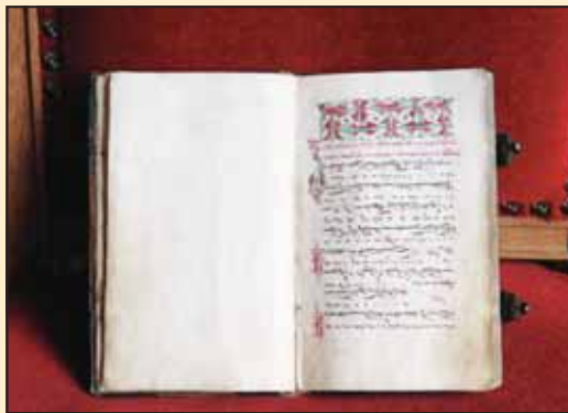
Стихологија из XVIII века