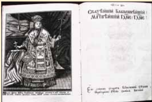
Стематографија Христифора Жефаровића.