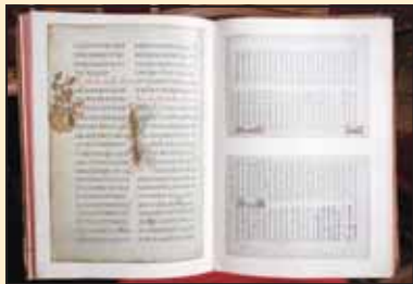
Фототипско издање Мирослављевог јеванђеља