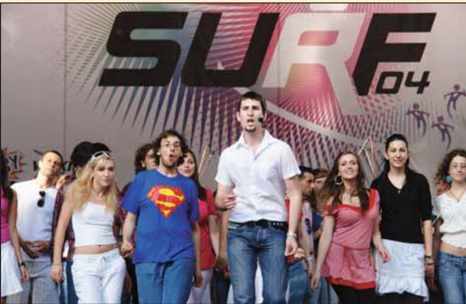
Лак за косу, ученички мјузикл на енглеском језику