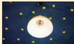
Детаљ с терасе испред читаонице