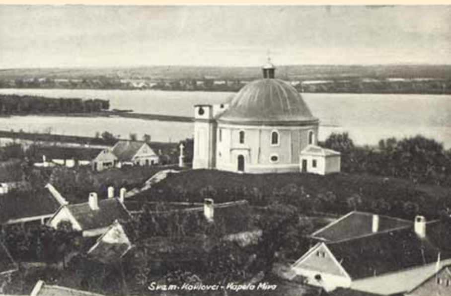
Св.м. Карловці - Капела Мисл