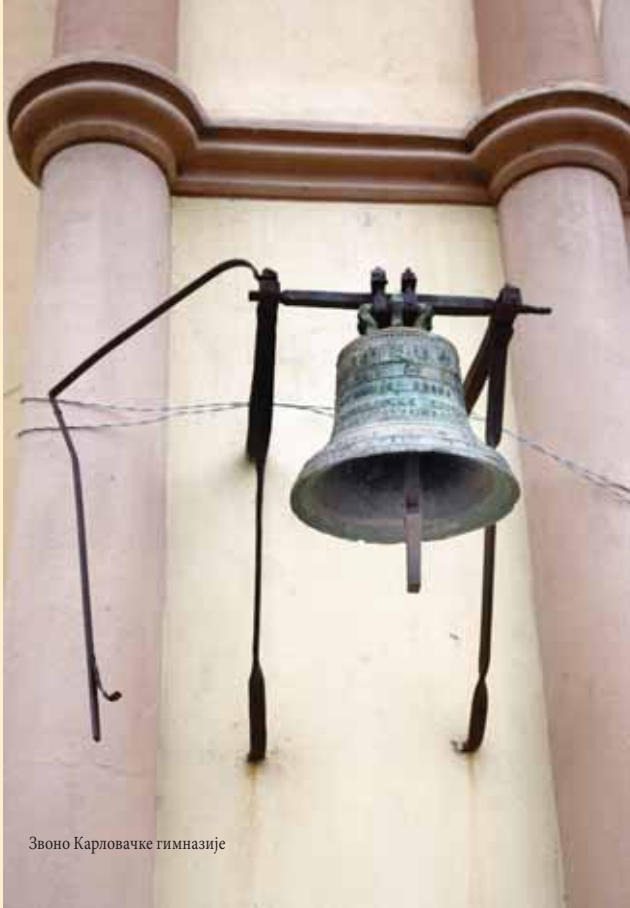
Звоно Карловачке гимназије