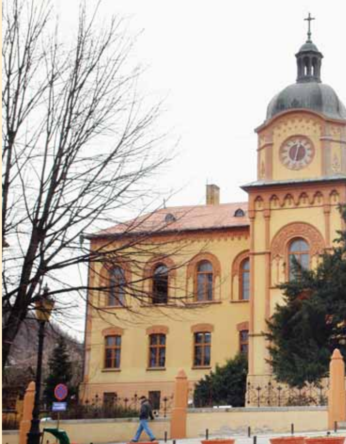
Фронтални изглед Гимназије