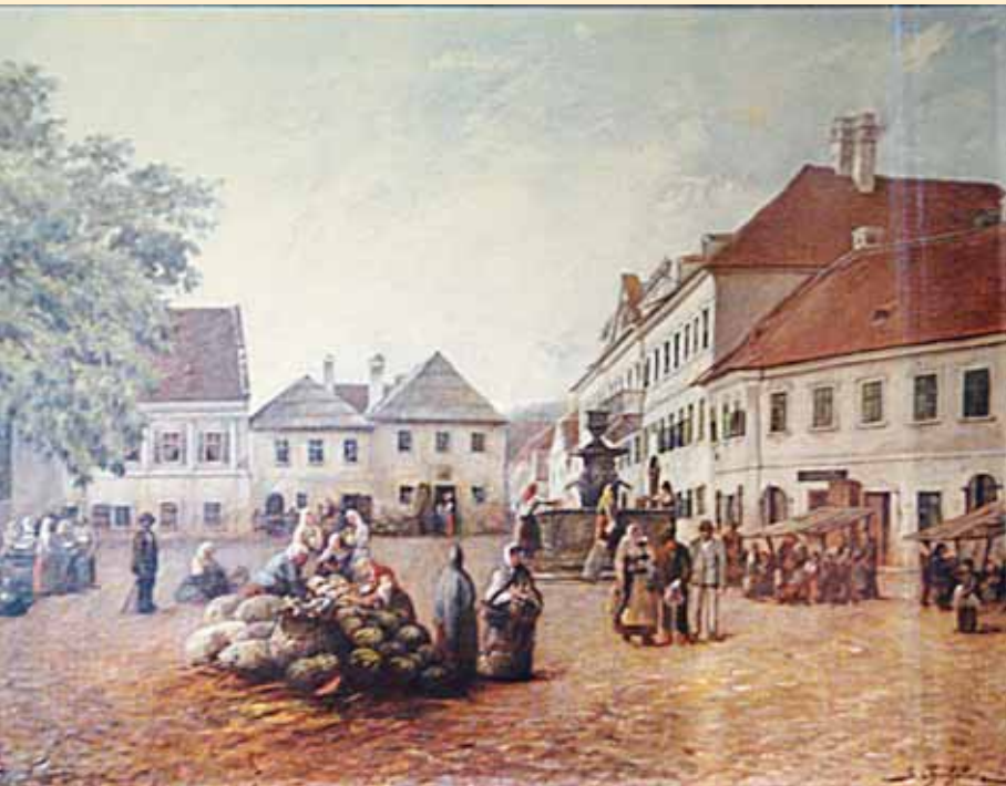
Некадашњи изглед центра Сремских Карловаца („Шећер трг“)