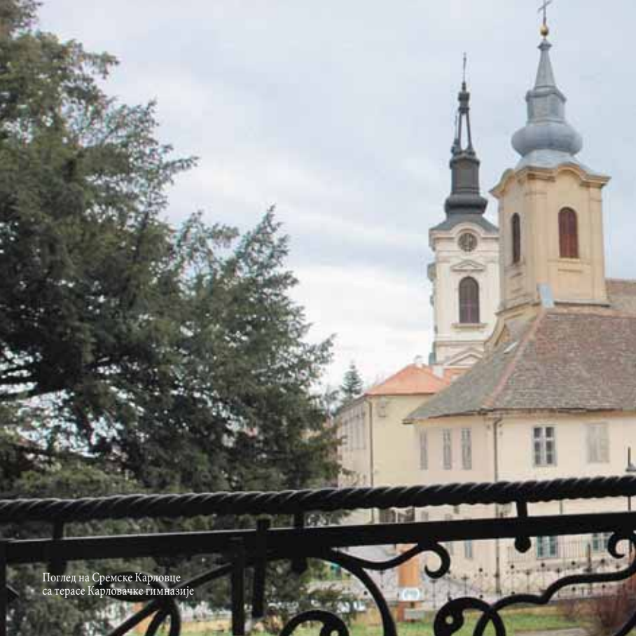
Поглед на Сремске Карловце са терасе Карловачке гимназије