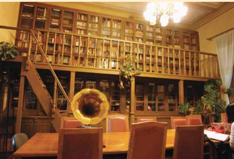
Читаоница Карловачке гимназије