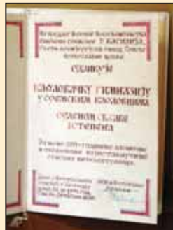
Орден св. Саве I степена

Године 1990. основано је Друштво за неговање традиције и развоја Сремских Карловаца, које је својим програмом, углавном, обухватило некадашње Удружење бивших карловачких ђака и професора, а чији чланови су се у знатном броју у њега