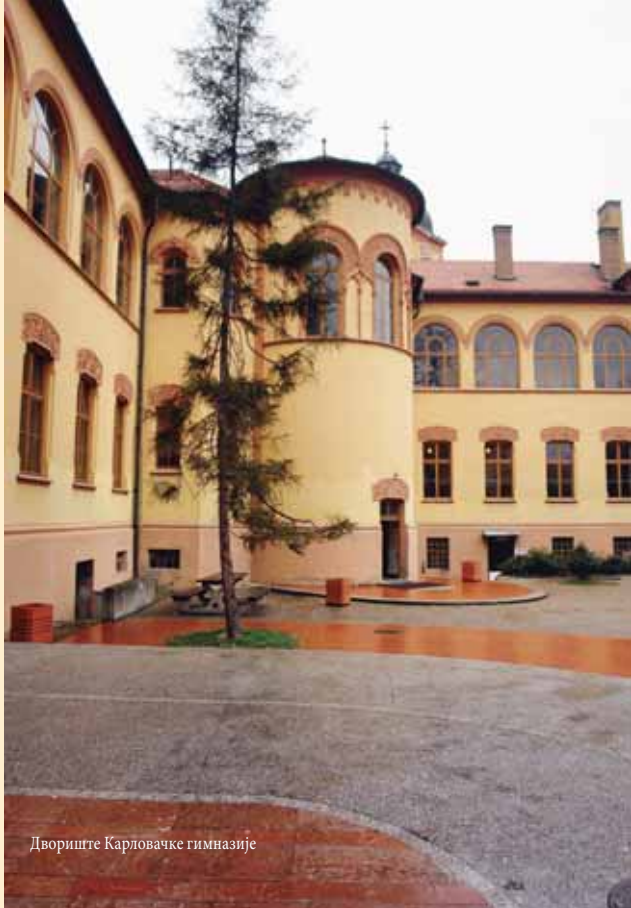
Двориште Карловачке гимназије