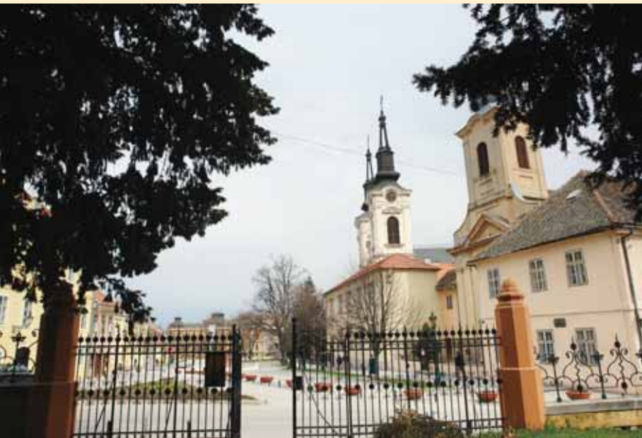
Поглед из гимназијског парка