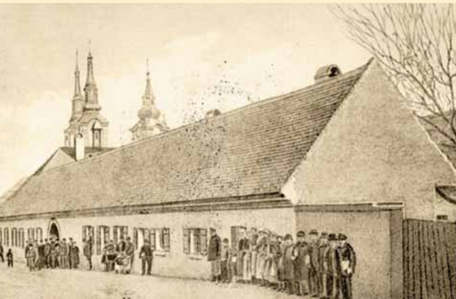
Стара зграда Карловачке гимназије