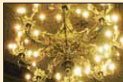
Лустер у Свечаној сали

писања, секције из беседништва... као и литерарни фондови Иван Радоњић и Филип Француски.