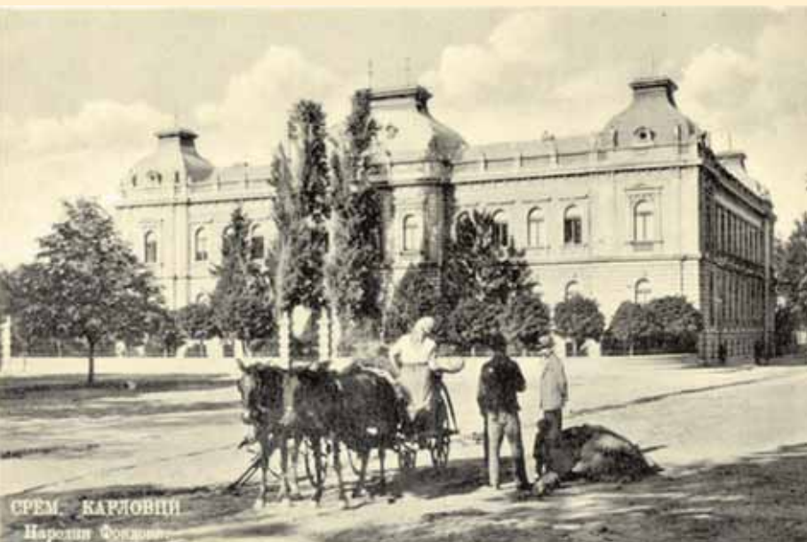
СРЕМ. КАРЛОВЦИ Народни Фондови.