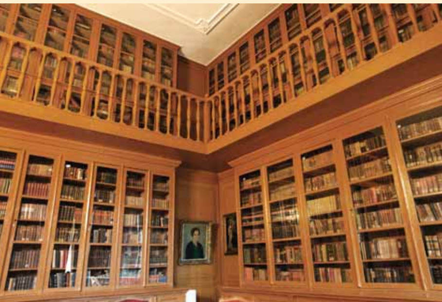
Спомен-библиотека Карловачке гимназије