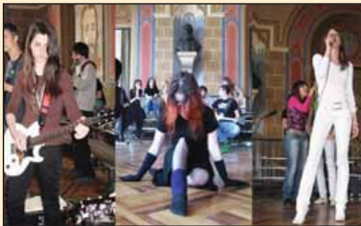
Дан толеранције и љубави у Карловачкој гимназији

У школи постоји Хор девојака Карловачке гимназије, школски лист Бранко, позориште на српском (позориште Козачински) и енглеском језику, школски оркестар и различите секције попут новинарске, радијске, еколошке, фотографске, ликовне, спортске, библиотечке, астрономске, информатичке, радионице креативног