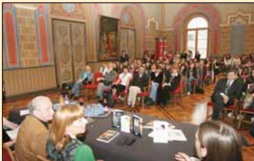
Међународни прозни фестивал у Карловачкој гимназији