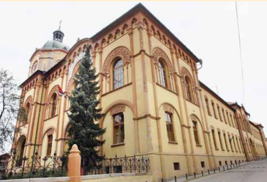
Бочни изглед зграде