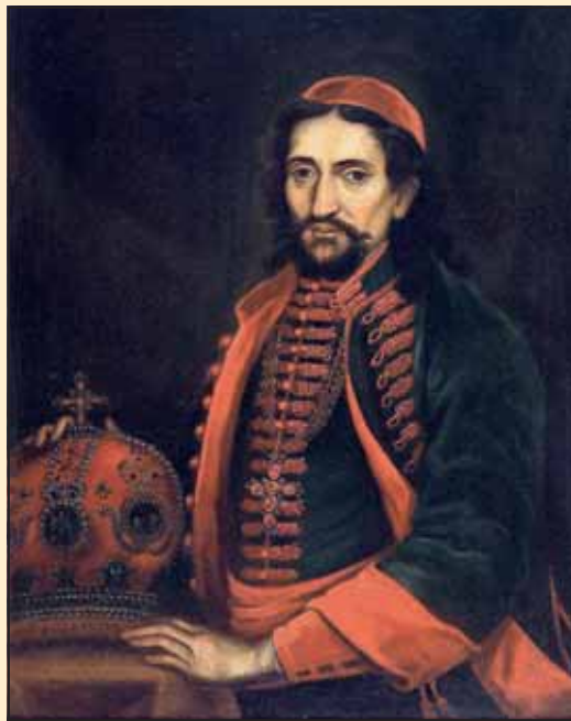
Митрополит Викентије Јовановић

гућио континуирани рад и одржао племениту замисао свог претходника да у Карловцима развија школство. Незадовољан радом и пона-