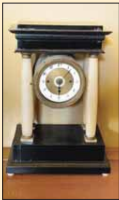
Поклон Карловачкој гимназији, канцеларија директора

и најчешће због недостатка огрева. Проблеми су настали и због недостатка адекватног стручног кадра и заузетости наставника на честим војним вежбама. Наставницима јеврејског порекла забрањен је рад; у школи су деловале разне усташке организације, а од 1937. године, када је формиран СКОЈ, деловала је у и организација Комунистичке омладине. Током ратног периода страдало је тридесет и двоје ученика, док је на присилан рад, у Немачку, из Карловачке гимназије одведено 9 ученика. Током Другог светског рата Гимназији су начињене велике штете. Библиотека је у више махова страдала. Из ње су однесене све вредније књиге, настале крајем 18. века; нестало је око 2.000 књижевних дела. У потпуности је нестала нумизматичка збирка, уништене су археолошка, природнописна и хемијска збирка.