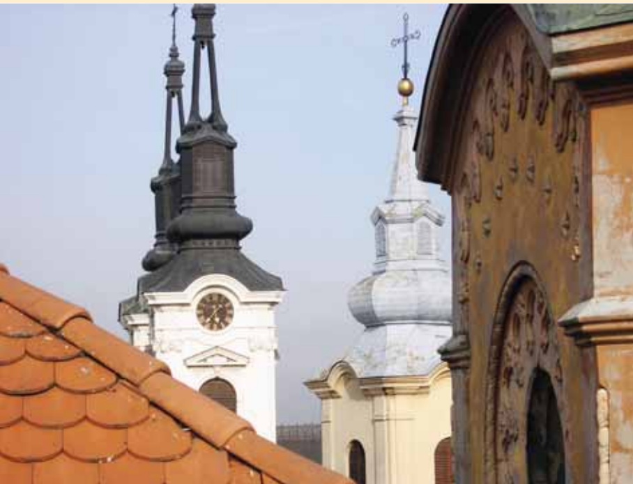
Поглед на кровове црква из Карловачке гимназије