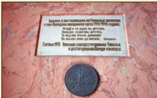
Спомен-плоча на улазу у Гимназију

10. маја 2007. године, одлуком Владе Републике Србије, Карловачка гимназија проглашена је школом од посебног националног значаја.