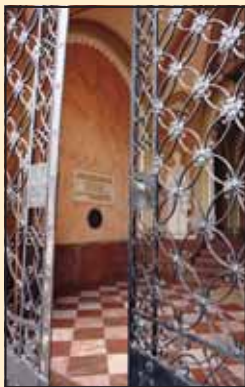
Улазна врата у Гимназију