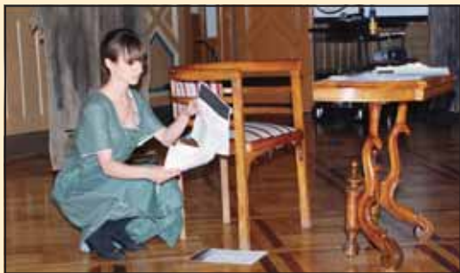
Сцена из представе, Позориште Козачински