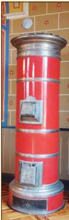
32 Пећ у Свечаној сали Гимназије

гимназије карловачке објављен је 1852/53. године. Из њега сазнајемо да је од овог периода у наставном процесу српски језик (народни језик с црквеном ортографијом) равноправан са немачким, те да се настава изводи и на српском језику. Ученици су, у то доба, веома добро говорили немачки језик, те су се њиме служили чак и у званичним обраћањима директору. У овом периоду ученик Карловачке гимназије био је и славни романтичарски поета, Бранко Радичевић.