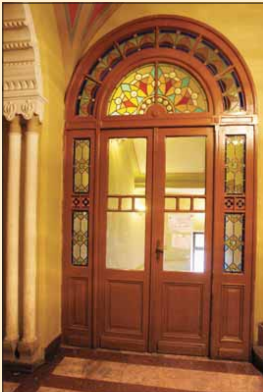
Врата у улазном холу

Патрони и директори, деталј из читаонице →