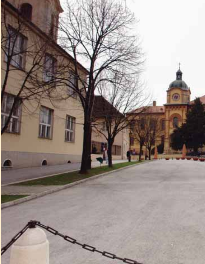
Трг Бранка Радичевића