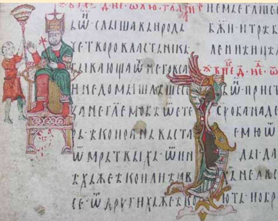
Детаљ из Мирослављевог јеванђеља