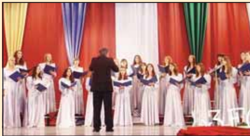
Хор девојака Карловачке гимназије