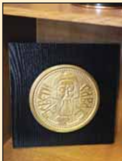
Медаљон св. Саве

и учланили. Удружење је иницирало оснивање Фонда за награђивање ученика Карловачке гимназије.