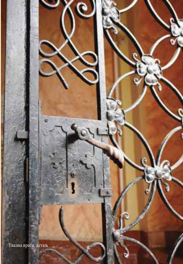
Улазна врата, детаљ